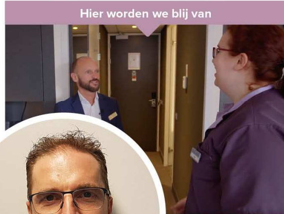
Hier worden we blij van