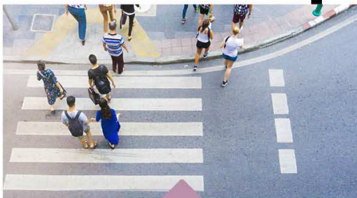
Kwaliteit en Veiligheid